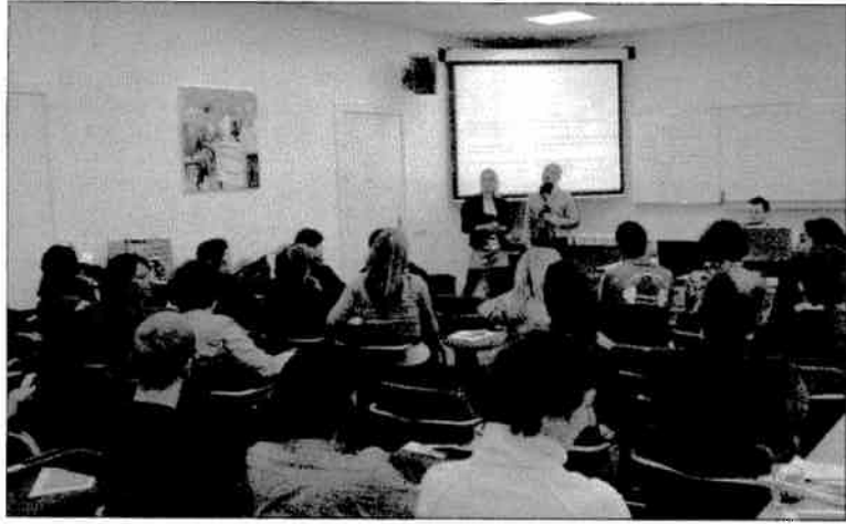
Pitchen is nooit makkelijk, helemaal niet voor collega's

Er stond de afgelopen tijd dus wel wat op het spel voor de makers. Dat viel ook te merken in de groep: onder druk van de tijd (er moest op 5 april een pitch worden gehouden), werd hard gewerkt aan het format en de presentatie ervan. Waren de bijeenkomsten aanvankelijk vooral brainstormsessies, die enigszins chaotisch verlopen maar wel een schat aan creatieve ideeën opleverden, de verdere sessies waren duidelijk meer doelgericht. Dat lag niet alleen aan de tijdsdruk. Gaandeweg heeft zich in het groepje, dat alle kanten uit ging en alles via consensus wilde doen, een soort leidinggevende kern gevormd van ongeveer drie mensen. Ongeveer drie, want de samenstelling wisselde met de beschikbaarheid van de leden. Taken werden verdeeld, waarbij rekening werd gehouden met de specifieke kennis en ervaring van de deelnemers. Het groepje veranderde in een crossmediaal redactieteam. Het resultaat bleef niet uit: na enkele vergaderingen stond een format in de